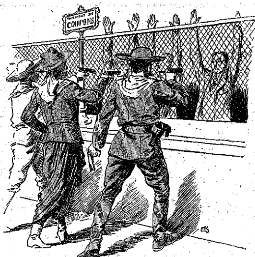
«Απάνω τα χέρια!...» (Σελ. 198, στ. γ')