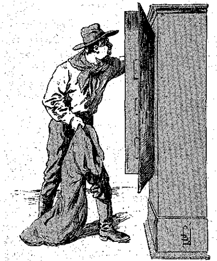
Ἐδέξασε μεθοδικώτατα εἰς ἕνα σάκκον ποῦ εἶχε...» (Σελ. 205, στ. 6')

εἰς τὴν ἐπιγεϊρήσιν των' αὐτοὶ ὁμῶς ἤξευραν καλά, ὅτι δὲν θὰ τοὺς ἄφιναν νὰ φύγουν ἀνενοχλητοί. Μόλις ἐφθασαν, τρώντι εἰς τὴν καμπὴν τοῦ δρόμου, ἠκούσθησαν ὀξεῖα συρίγματα καὶ οἱ χωροφύλακες ποῦ τοὺς ἐπερίμεναν ἐκεῖ, ἐδοκίμασαν νὰ τοὺς σταματήσουν. Συγχρόνως ἠκούσθησαν δύο πυροβολισμοὶ καὶ ὁ Ραοὺλ εἶδε τοὺς χωροφύλακας κυλιόμενους εἰς τὴν σκόνην τοῦ δρόμου. Ἐσηκώθησαν ὁμῶς ἀμέσως. Ἡ μίς Μπριδὺ με τὴν ἀλόνησάστον καρμπιναν τῆς, δὲν εἶχε σκοπεύσῃ αὐτούς, ἀλλὰ τ' ἄλογά των, τὰ ὁποία κατέκιντο τὴν κ' ἐξεψυχοῦσαν, σκόπτοντα με τὰς ὀπλάς των τὸ ἔδαφος. Ποὺ λλ χοὺ π! Ὁ δρόμος ἦτο τώρα ἐλεύθερος καὶ ὁ μικρὸς ὄμιλος ἐξώρμησε με τριπλοῦν καλπασμόν, ἀρίων ὀπίσω του ὄλους τοὺς ἱππεῖς, οἱ ὅποιοι προσέτρεχον πανταχόθεν πρὸςπαθόντες νὰ τοὺς συλλάβουν. Οἱ κλέπται ἤξευραν, ὅτι τὰ ἐντόπια