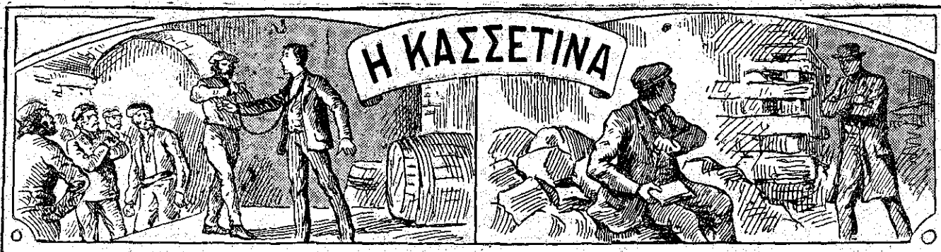
ΚΕΦΑΛΑΙΟΝ Β'. (Συνέχεια)

Είνε χαρτιά. Είς τὸ σκότος, τὰ μετὰ ψηλαφ- τεί. Είνε καμμιὰ δωδεκαριά κ' ἔχουν τὸ σῆμα ἐπιστολῶν. Ἐπιστολαί; Τί ἐπιστολαί εἶνε αὐ- ταί; Καὶ ποίος τὰς ἔχουσεν ἐκεῖ- μέσα; Ἐξαφνα ἐνθυμείται τὸν τρελλόν. Ὅταν ὁ δυστυχῆς, τὸν ὅποιον ἐβοή- θησεν εἰς τὸ Σόχ ο σ κ ο υ ε ἶ ρ, τοῦ ἐπέστρεψε τὸ σακκάκι, τὸ ὅποιον εἶχε ρίψει εἰς τοὺς ὠμούς του, ἐγελοῦσεν, ἐγελοῦσεν, ὡς ἄνθρωπος ποῦ ἔκαμε κά- τι καλὸν καὶ εἶνε εὐχαριστημένος. Αὐτὸς, χωρὶς ἄλλο, θὰ ἔχουσε τὰ χαρτιά μεταξὺ τῆς φόδρας καὶ τῆς τόσχας τοῦ σακκακιῦ του. Ἄλλὰ δι- ατί;