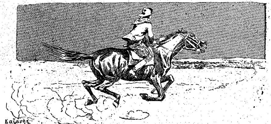
«Ο Ραούλ εκάλπαζε προς την πόλιν.» (Σελ. 198, στ. α.)

κρόν, άπεκρίθη ό Ραούλ πειρογμένος από αυτήν την έπιμονήν. Δέν είμαι κανένα μωρό. Θα μπορούσα να κάμω και άλλα, πολύ δυσκολότερα άπ' αυτά που μου ζητείτεσ.