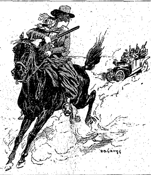
«Ἡ σφαῖρα τῆς μίς Μπριδὺ εἶχε διαρρήξῃ τὸ καουτσούκ...» (Σελ. 206, στ. β')

ἀδειασεν μεθοδικώτατα εἰς ἕνα σάκκον ποῦ εἶχε φροντίσῃ νὰ πάρῃ μαζί του. Τρία συρτάρια καὶ ἕνα χρηματοκιβώτιον ἀνοικτὸν εἰς τὸ γραφεῖον τοῦ προϊσταμένου, ἐξεκενώθησαν εἰς ὀλίγας μάλιστα στιγμᾶς. Ἐξάφνα ἀντήχησεν ἡ διαταγή: —Στ' ἄλογα, μπῦ! Συγχρόνως εἰ τρεῖς ἄνδρες καὶ ἡ μίς Μπριδὺ, ἡ ὁποία εἶχε πιάσῃ τὸν Ραοὺλ ἀπὸ τὸ χερί, ὀπισθοχώρησαν σιγά-σιγά πρὸς τὴν θύραν, ἐξακολουθώντας νὰ σκοπεύουν τοὺς εὐρισκομένους εἰς τὴν Τράπεζαν. Ὅταν ὁ σὲρ Ράλοφ ἤσθάνθη ὀπίσω του τὸ χερί τῆς ἐξωθύρας, ἐφώναξεν «Ἐμπρός!», καὶ ὅλοι μαζί, μὲ μίαν ταχύτητα καταπληκτικὴν, ἐξηφανίσθησαν ἀπὸ τὴν θύραν αὐτήν. Μόνον τότε, ὁ προϊστάμενος ὄρμησεν εἰς ἕνα παράθυρον, τὸ ἀνοίξε καὶ ἤρχισε νὰ φωνάζῃ: —Κλέφτες!.. Βοήθεια!.. Πιάστε τους!.. Ὁ γονδρὸς πελάτης, ἀπαλλαγθεὶς ἀπὸ τὰ ρεβόλβερ, ἐπρεξεν εἰς τὸν δρόμον κ' ἐφώναξε καὶ αὐτὸς «πιάστε τους!» μὲ ὄλην του τὴν δύναμιν. Οἱ διαβάται ἕκασταν τὸ ἴδιον καὶ μετ' ὀλίγον, εἰς τὸ ἄκρον τοῦ δρόμου, ἐφάνησαν ἐπιπτοὶ χωροφύλακες. Ἦτο πολὺ ἀργά. Οἱ τέσσαρες κλέπται ἐπρόφθασαν νὰ καθαλιεύσουν τὰλόγα των καὶ νὰ πάρουν καλπάζοντες τὸν κατήφορον. Τὸν Ραοὺλ ἀνῆρπασε τὸ στιβαρὸν χερί τοῦ Λό καὶ τὸν ἐκάθισεν εἰς τὸ ἐμπροσθεν μέρος τῆς σέλλας του. «Ποὺ λλ χοὺ π!» ἐφώναξεν ἡ μίς Μπριδὺ μαστιζώσα τὴν θουμασίαν μαύρην τῆς φορέδα, ἡ ὁποία ἐφειγεν ὡς θέλος πρὸς τὴν ἐξοχὴν. Ἡ καταδιώξις Πρὸς στιγμὴν ὁ Ραοὺλ ἐνόμισεν, ὅτι οἱ τολμηροὶ κλέπται ἐπέτυχον τελειῶς