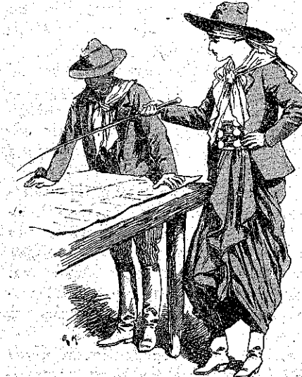
«Να ή πόλις Μενδόζα, τώ έλεγε.» (Σελ. 191, στ. α.)

—Μάλιστα, ένόησα. —Μά να προσέξης μη λησιμονήσης τίποτε. —Δέν θα λησιμονήσω τό παραμύθιον.